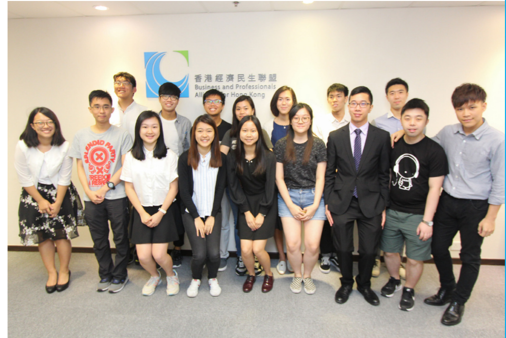
活動完竣後，實習生與舊生來個大合照，標誌著新一屆實習計劃正式展開！

今年共有 17 位大專院校生參與實習計畫，當中包括修讀法律、政治及公共行政、社會科學、英文等不同範疇的同學，以互補長短、互相切磋，並擴闊我們的社交圈子。此冊子亦紀錄了我們難忘的回憶和得著，讓我們一起回顧吧！