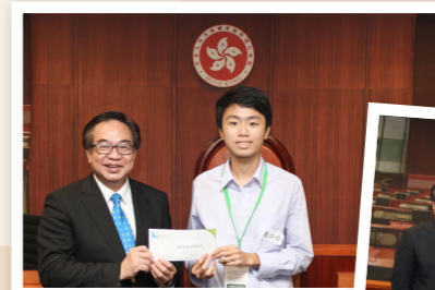
盧偉國主席頒獎予辯論比賽中表現優秀的同學。