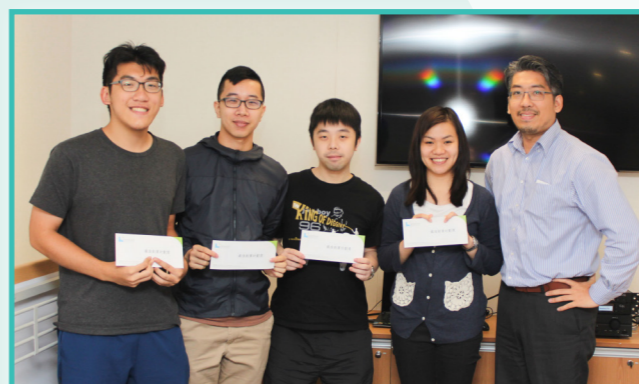
各組完成匯報後，由其中一組同學獲得「最佳創業計劃獎」以示鼓勵。