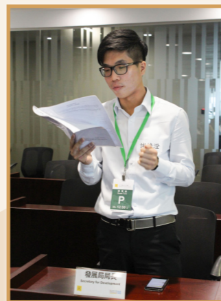
同學正扮演發展局局長回應其他議員的提問。