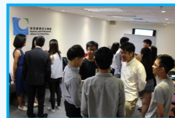
同學在進行破冰遊戲時，需要介紹自己的名字、興趣及喜歡的食物。

另外，各地區主管亦向同學們分享地區工作點滴，讓大家明白到「民生無小事」；而總部主管則鼓勵同學在實習當中主動學習和積極發問，提出自己的意見，希望大家經過這次實習，加強批判思考、增加對社會及政治的關注、學習待人接物和發揮團隊精神。