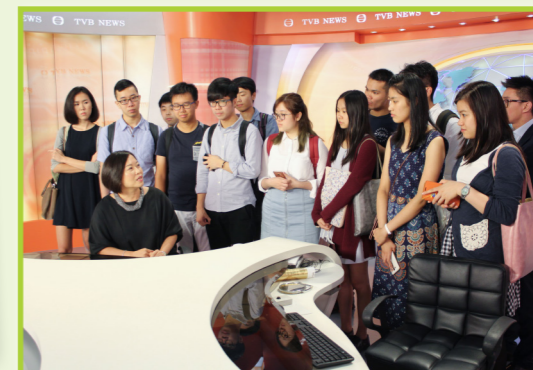
黃總監為同學們詳細講解新聞編審的工作。