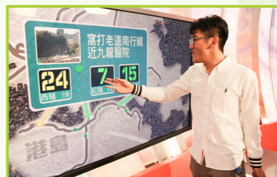
同學裝成主播，利用互動熒幕向大家講解即時交通消息。