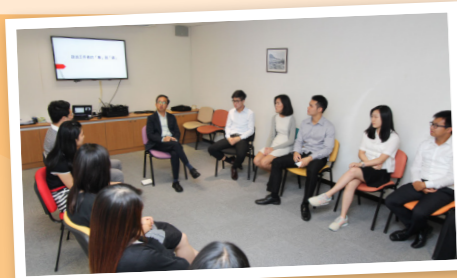
完成熱身遊戲後，陸先生正式展開「與CEO對話」，與大家暢談工作多年的所見所聞。