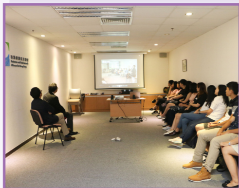
同學們一同重溫六星期實習計劃的點滴。