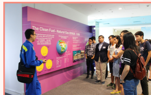
工程師透過模型為同學們講解龍鼓灘發電廠的設施及世界能源發展。

完成上午的活動後，我們下午便乘車前往中電位於龍鼓灘的發電廠，在任職工程師的專業導賞員帶領下，遊覽了發電廠內外的設施和重要機組，導賞員更沿途為大家講解發電廠的運作和能源使用狀況，亦介紹了廠房歷史和分享工作趣聞等，令同學大呼過癮。