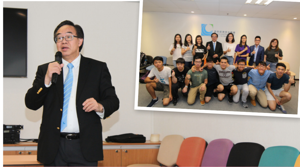
盧偉國主席百忙中抽空為實習生們舉行政治專才講座。

政 治議題與我們的生活息息相關，有著不可分割的微妙關係。今年，我們邀請了經民聯主席、立法會議員盧偉國博士為實習生舉行政治專才講座，與實習生分享他對熱門政治議題的見解及個人從政心得。