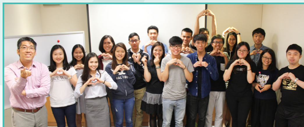
同學們都非常享受講座及工作坊的過程，並了解到有關創業的基礎知識和注意事項。