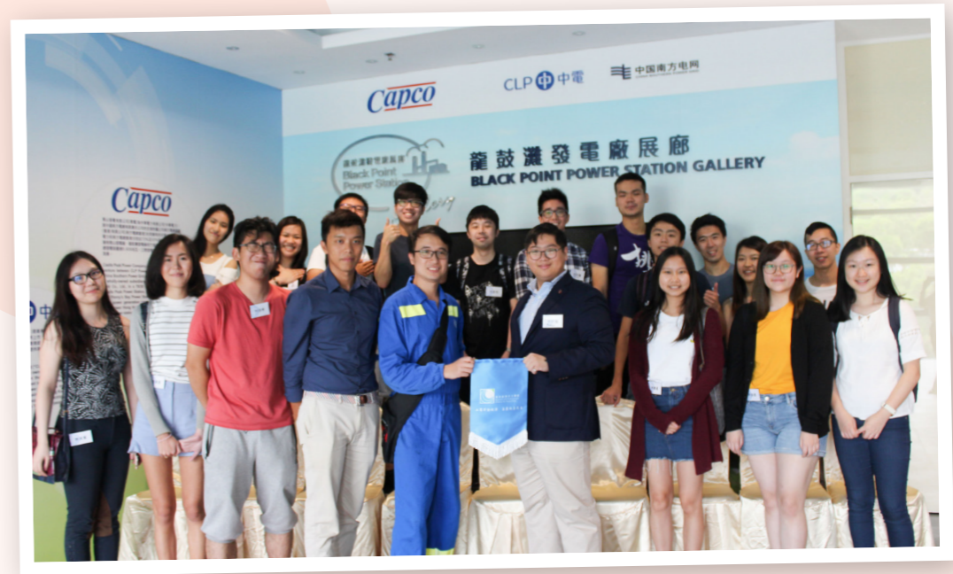
在活動尾聲，同學們與中電工作人員合照，並代表經民聯向中電致送紀念旗以示感謝。