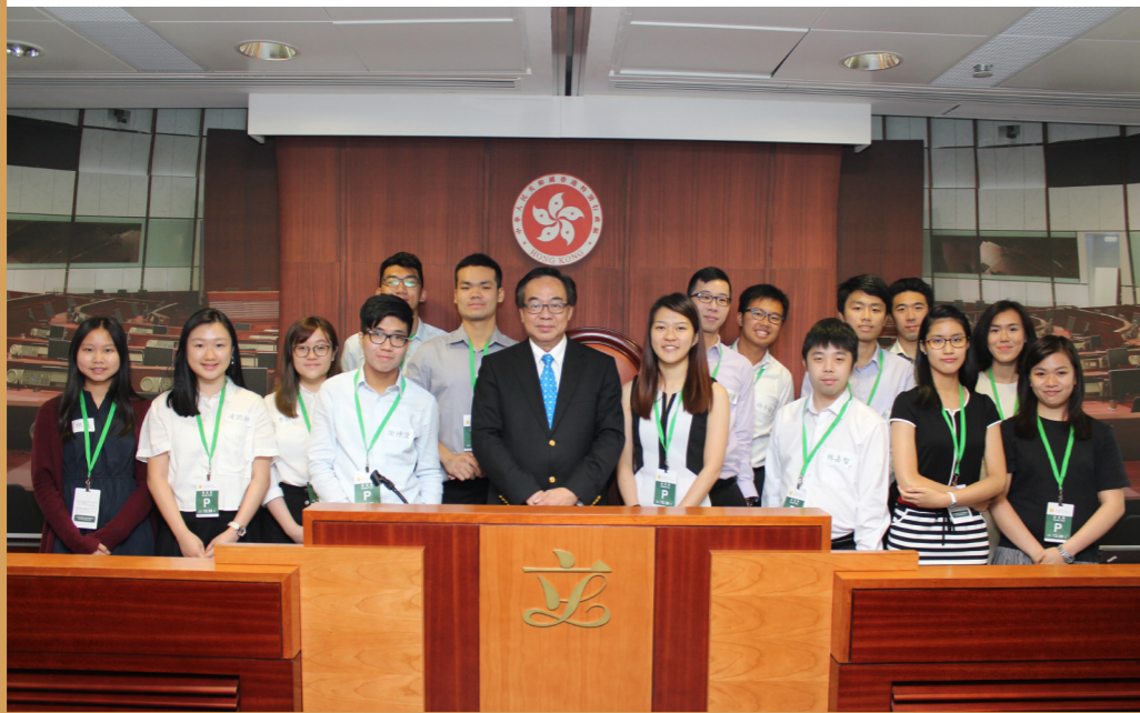
同學們在辯論後與經民聯主席盧偉國博士合照留念。

為 提升實習生對本港立法機關的認識，經民聯特意安排立法會綜合大樓參觀活動，由隨行的導賞員向實習生詳盡講解，使他們更了解立法會的運作、歷史，以及議員的日常工作。當天，參觀同學亦有幸看到立法會進行有關《道歉條例草案》的討論，並隨之進行了一場精彩及富意義的立法會模擬辯論比賽。