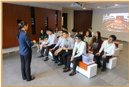
立法會綜合大樓內的導賞員向同學講解立法會的結構和運作。

在立法會的職員指導下，實習生進行了一場立法會模擬辯論比賽，就『推行古跡旅遊』辯論。同學們對辯論都做足事前準備，資料搜集非常詳盡，列舉各樣本地及海外例子，展現出積極態度，在大家的參與下，比賽得以順利完成。