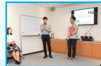
兩位師兄分享以往的實習經驗，並向我們作出鼓勵，提醒我們要盡情享受實習帶來的不同經歷。