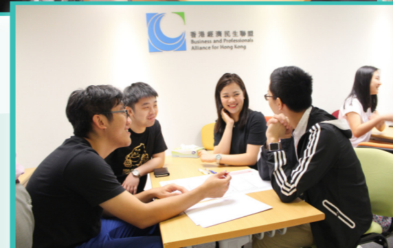
同學們都專心討論和構思各自分組的創業方向。