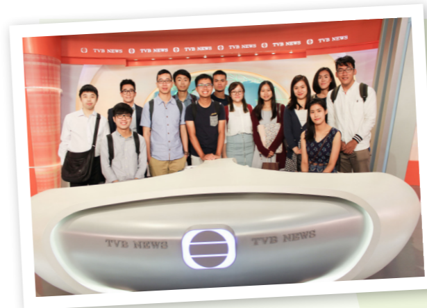
同學們欣喜地在直播室拍下大合照留念。