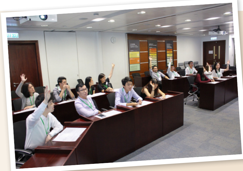
同學們正進行有關古蹟旅遊發展議案表決。