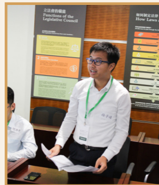
實習同學正作出「二讀」的程序示範，為其他同學說明條例草案（法案）的主要內容，以及立法的意圖。