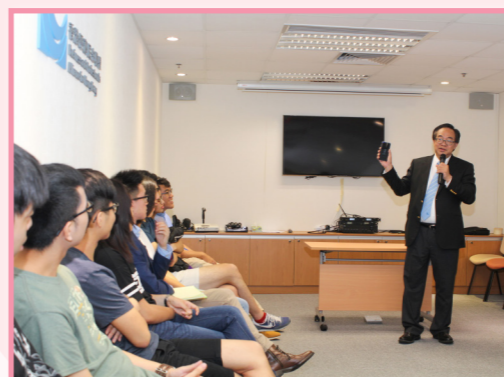
盧主席與實習生分享他對一帶一路及粵港澳大灣區的見解，大家亦即席發問。

盧主席認為，香港在對外關係及國際化程度方面相較內地城市有顯著優勢，故應積極發揮超級聯繫人的角色，在粵港澳大灣區中與珠三角城市合作，推動不同產業發展。盧主席還與眾人討論不同範疇的議題，並分享自己在偶然機會下成為沙田區議員，其後再加入立法會代表工程界別爭取權益。這樣的切實交流，同學們直言獲益甚豐，亦增加了對政治的認識。