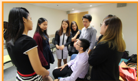
所有實習生共分成兩組，大家正在商量用什麼方法勝出遊戲。