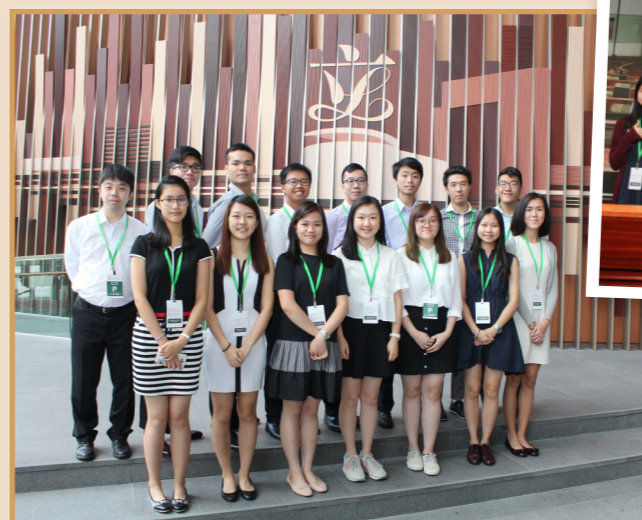
同學們在立法會內拍照留念，看來非常享受是次參觀活動。