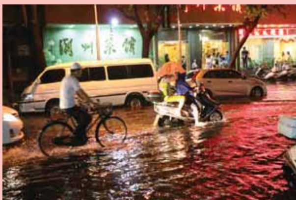
一場滂沱大雨，馬路變成「河」。

這一突發事件，固然反映出內地城市建設和城市管理上存在的一些問題，讓學員們對內地的發展現況有親身的體驗，同時也讓學員們增加了一次學習應對突發事件和危機處理的機會。